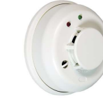
Détecteur de fumée DXS-73

Caractéristiques spéciales de la console PERS Outre les trois modes opérationnels, votre console PERS comporte plusieurs fonctionnalités spéciales pouvant être activées ou désactivées par votre service de surveillance.