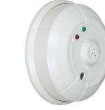
Détecteur de monoxyde de carbone DXS-80