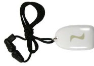
Détecteur bracelet DXS-LRC